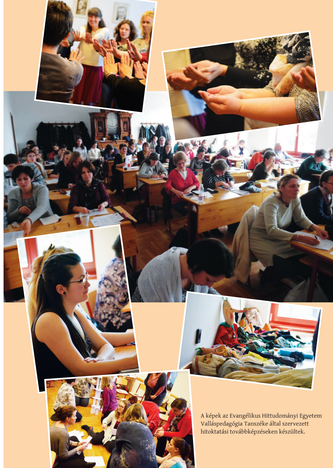
A képek az Evangélikus Hittudományi Egyetem Valláspedagógia Tanszéke által szervezett hitoktatási továbbképzéseken készültek.